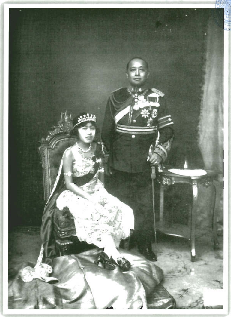
พระบาทสมเด็จพระมงกุฎเกล้าเจ้าอยู่หัว ฉายร่วมกับสมเด็จพระนางเจ้าอินทรศักดิศจี พระวรราชชายา