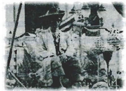
ภาพประกอบ 1 พระราชพิธีบรมราชาภิเษกใน พระบาทสมเด็จพระเจ้าอยู่หัว รัชกาลที่ 9

สิริราชสมบัติแล้วในวันที่ 19 สิงหาคม พ.ศ. 2489 อันเป็นวันกำหนดเสด็จกลับไปทรงศึกษาต่อใน ต่างประเทศระหว่างประทับรถพระที่นั่งเพื่อเสด็จ พระราชดำเนินไปขึ้นเครื่องบินนั้นได้มีเสียงร้องมา จากกลุ่มพสกนิกรที่เฝ้าส่งเสด็จว่า “อย่าทิ้ง ประชาชน” และได้มีพระราชดำรัสตอบในพระราช หนุทัยว่า “ถ้าประชาชนไม่ทิ้งข้าพเจ้าแล้ว ข้าพเจ้า จะทิ้งประชาชนอย่างไรได้” (กรมประชาสัมพันธ์, ม.ป.ป.) พระราชหนุทัยที่ทรงตั้งไว้ดังนี้ เสมือนเป็น การพระราชทานสัญญาว่าจะทรงเป็นร่มบรมโพธิสมภาร ของพสกนิกรตลอดไป