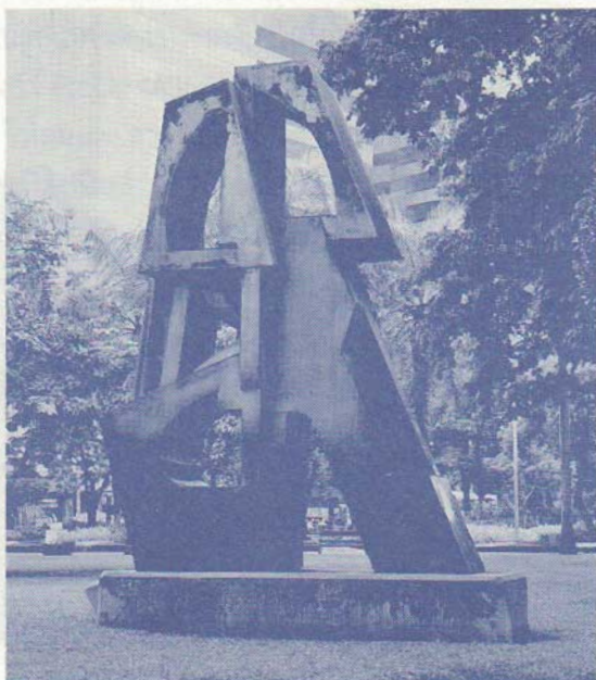
ภาพที่ ๒ ชื่อผลงาน : หญิงชายอาเขียนพูนสุข : ๒๕๓๐ โดยประติมากร : ชาบรี พี.จี. โมฮัมหมัด : ประเทศบรูไน เทคนิค : ขนาด : เชื่อมแผ่นสำริด : สูง ๔๑๕ เซนติเมตร (ที่มา อุดลย์ บุญฉ่ำ .ออนไลน์. ๒๕๕๕)