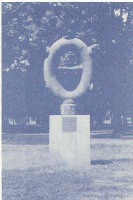
ภาพที่ ๓ ชื่อผลงาน : ปฏิสนธิฐาน (Dialogue): ๒๕๒๖ โดยประติ มากร : มอน มุดจิมาน (Mon Mudjiman):ประเทศอินโดนีเซีย (Indonesia) เทคนิค : ขนาด : ดุนนูนทองแดง : สูง ๑๔๗ เซนติเมตร (ที่มา อดุลย์ บุญฉ่ำ .ออนไลน์. ๒๕๕๕)