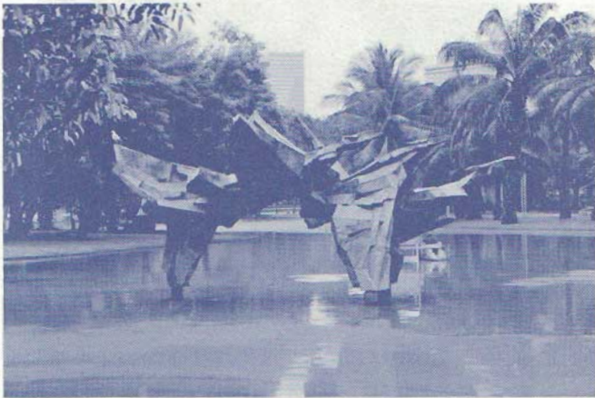
ภาพที่ ๑ ผู่งนก ( Flock : ASEAN Birds ) : ๒๕๒๖ โดยประติมากร : โวลอมอล อวาโล แซบริด (Solomon ArevaloSaprid) เทคนิค : ขนาด : เชื่อมแผ่นทองเหลือง : กว้าง ๗๕๐ ยาว ๔๕๐ สูง ๒๗๐ เซนติเมตร