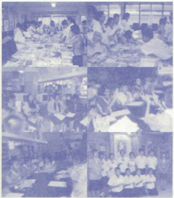
ภาพ 1 ภาพนักเรียนที่เข้าร่วมโครงการ เลือก หนังสืออ่าน เข้าร่วมวงสนทนาในกลุ่มเพื่อนๆ และครู ผู้แนะนำการอ่าน เพื่อเล่าเรื่องสู่กันฟัง ในกิจกรรม ยอดนักเล่าเรื่อง และภาพการรับเกียรติบัตร ของนักเรียน ในกิจกรรมยอดนักอ่าน

ต่อไปนี้เป็นภาพประมวลภาพเหตุการณ์ การดำเนินกิจกรรมพัฒนาการอ่านในโครงการ