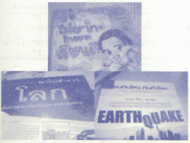
ภาพ 2 ตัวอย่างหนังสือที่นักเรียนเลือกอ่าน ในกิจกรรม กลุ่มยอดนักอ่านเชิงประยุกต์